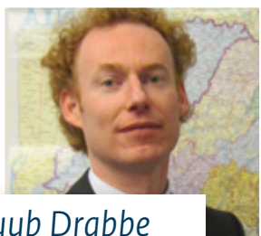
Huub Drabbe Nederlandse ambassade Boekarest

De overheid zet zich actief in voor de belangen van bedrijven en organisaties in het buitenland. Door het positioneren van bedrijven, kennisinstellingen en sectoren of het verminderen van handelsbarrières. Ook voor hulp bij zakelijke problemen of lokale procedures kunt u bij ons terecht. We kunnen niet altijd een oplossing garanderen, maar we kunnen ons wel hard maken voor uw belangen en via de juiste contacten het gesprek aangaan.